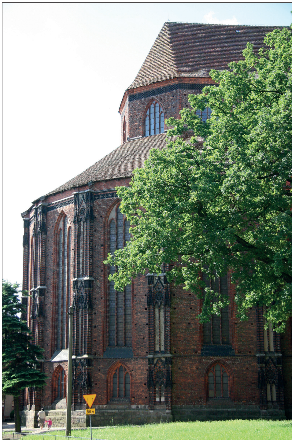
Ryc. 7. Stargard, kościół Mariacki, dekoracyjne pasy lizen na elewacji chóru.