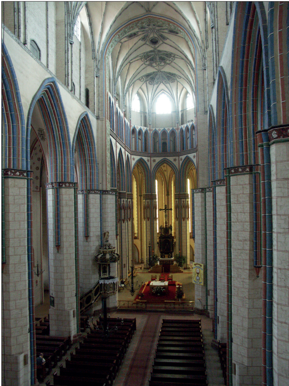
Ryc. 2. Stargard, kościół Mariacki, widok w kierunku wsch.