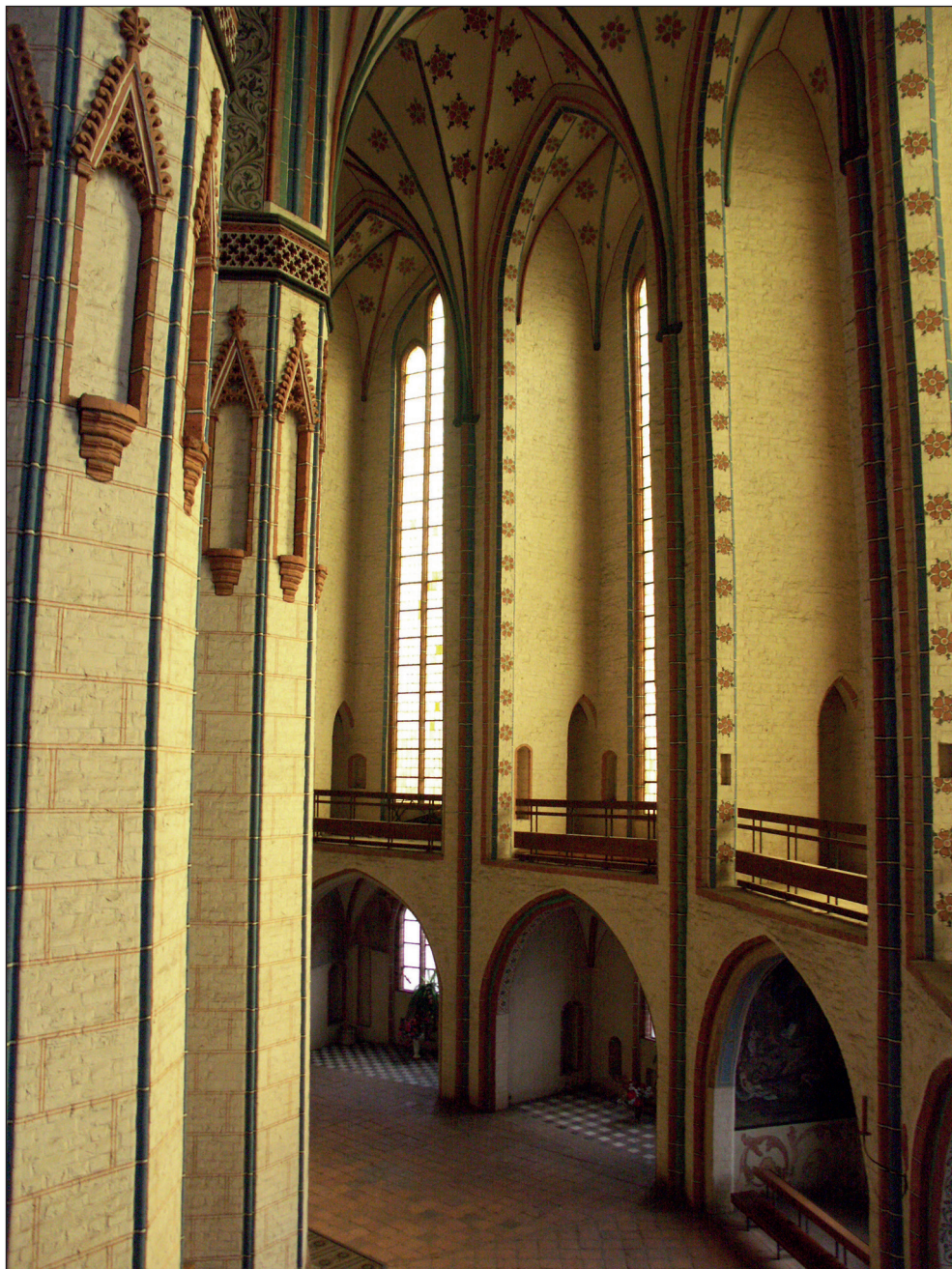
Ryc. 6. Stargard, kościół Mariacki, obejście chóru.