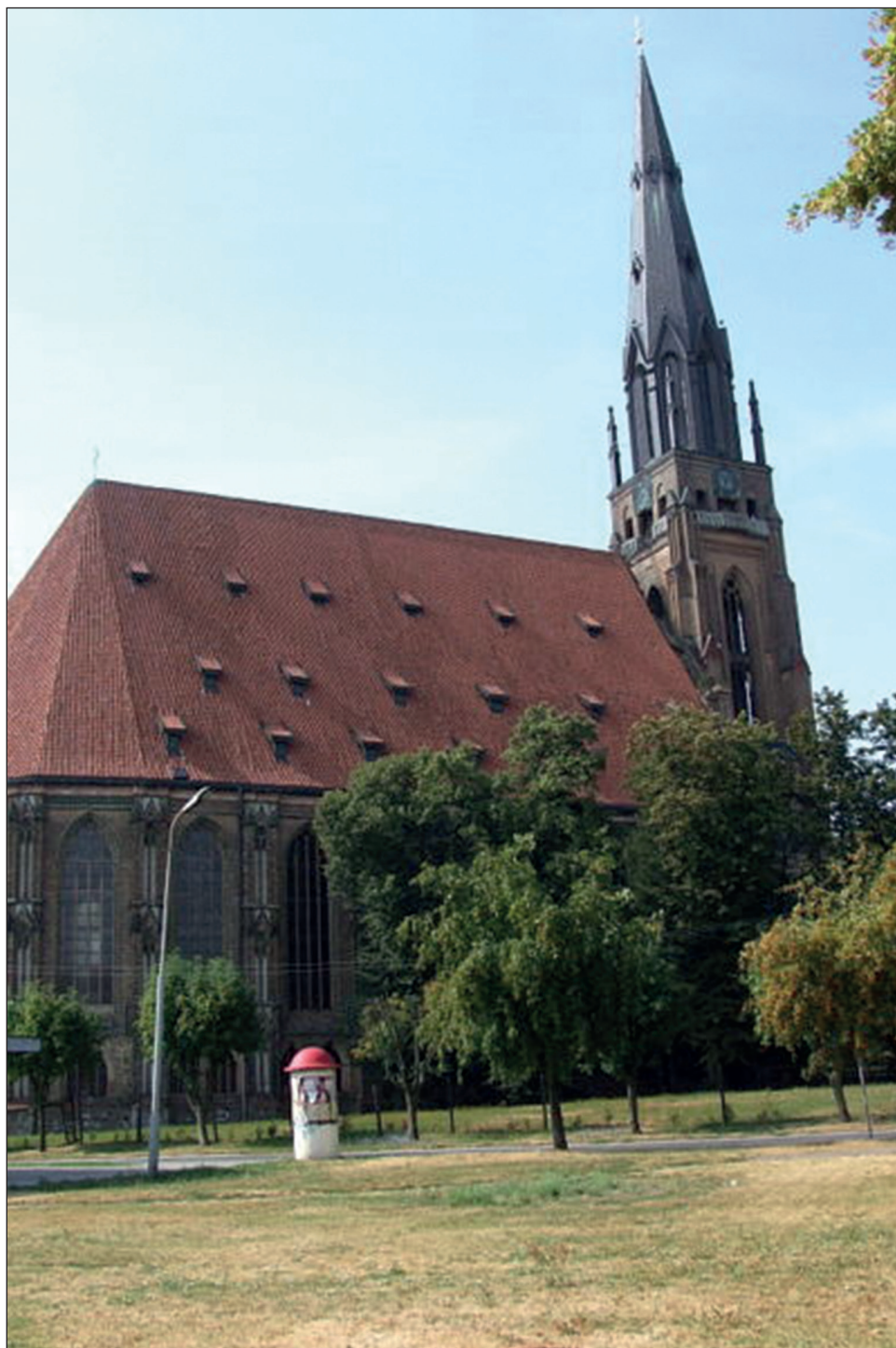
Ryc. 3. Chojna, kościół Mariacki, widok od północy.