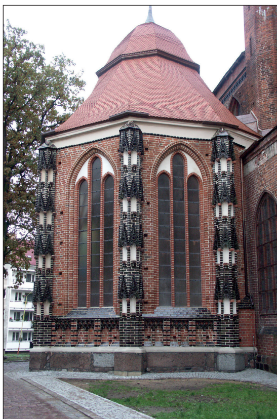
Ryc. 5. Stargard, kościół Mariacki, kaplica Mariacka od zach.