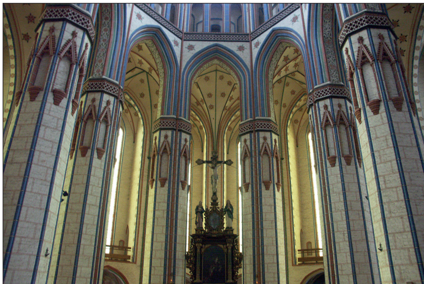
Ryc. 4. Stargard, kościół Mariacki, widok chóru.