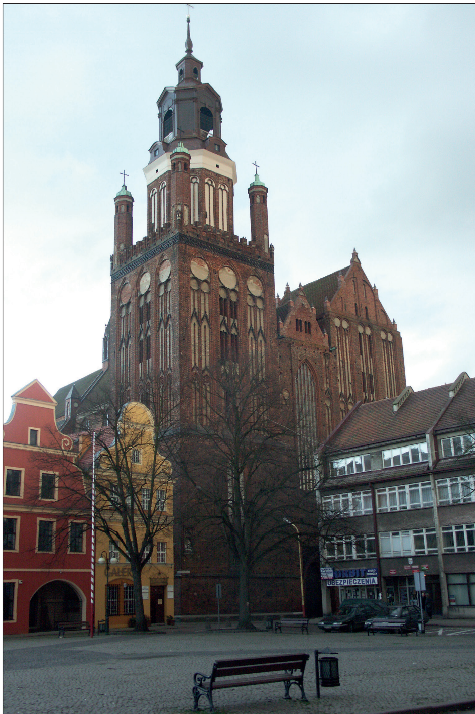
Ryc. 1. Stargard, kościół Mariacki, widok z rynku na fasadę dwuwieżową.